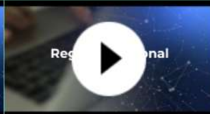
Registro Nacional de Cáncer (RNC)