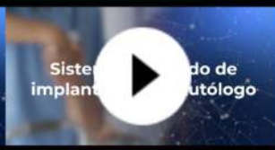
Sistema integrado de implante de piel autólogo (SIIPA)