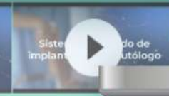
Sistema integrado de implante de piel autólogo (SIIPA)