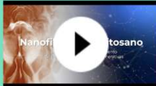
Nanofibras de Quitosano para prevenir Enfermedades Neurodegenerativas