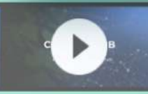
COBETAAFOB: La alternativa al uso de antibióticos en la acuicultura