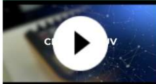
CERTEMED: Organismo de Inspección de Dispositivos Médicos