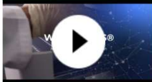
WikiGen SRS® Kit Molecular para detección Piscirickettsia Salmonis 1

*Este portafolio se encuentra constantemente en construcción, incorporando nuevas tecnologías en desarrollo.