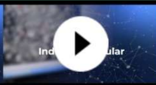
Plataforma Industria Circular